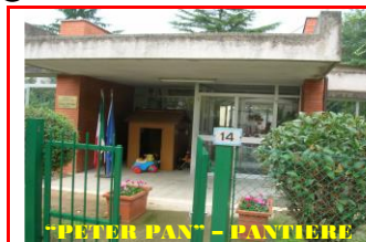
“PETER PAN” - PANTIERE

MONTE ROBERTO - CASTELBELLINO - SAN PAOLO DI JESI SCUOLA DELL’INFANZIA – A.S. 2019/20