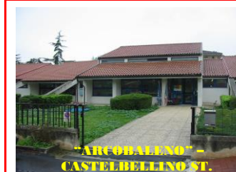
“ARCOBALENO” - CASTELBELLINO ST.