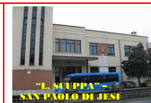
“L. SCUPPA” - SAN PAOLO DI JESI